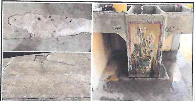
Foto 6: Piso de cemento liquido de aula inservible, piso de concreto de patio en mal estado y pila con gran deterioro.

Observación: Si es necesario se pueden agregar hojas adicionales y actualizar el número de hojas.