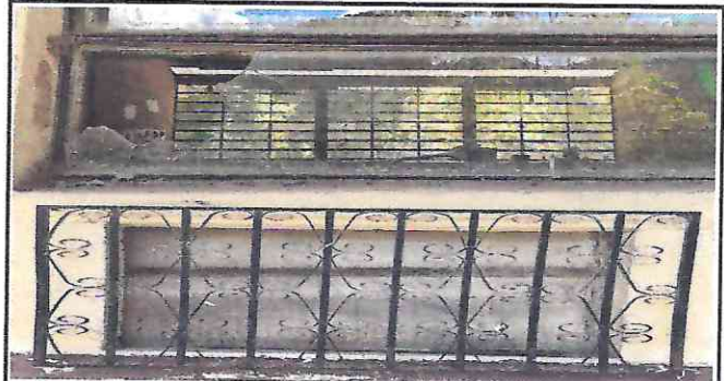
Foto 4: Vidrios rotos y ventanas no existen al igual que balcones en mal estado.