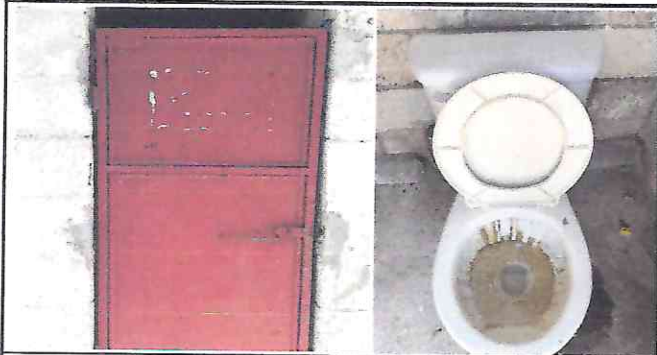
Foto 3: Puerta de Sanitario en completo deterioro al igual que la taza del sanitario