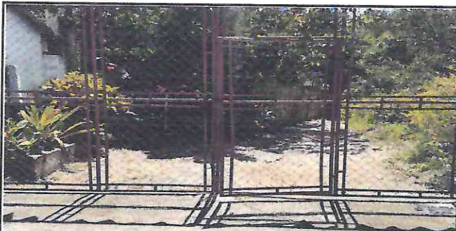
Foto 5: Porton e cuatro hojas inservible necesita mantenimiento y reparación